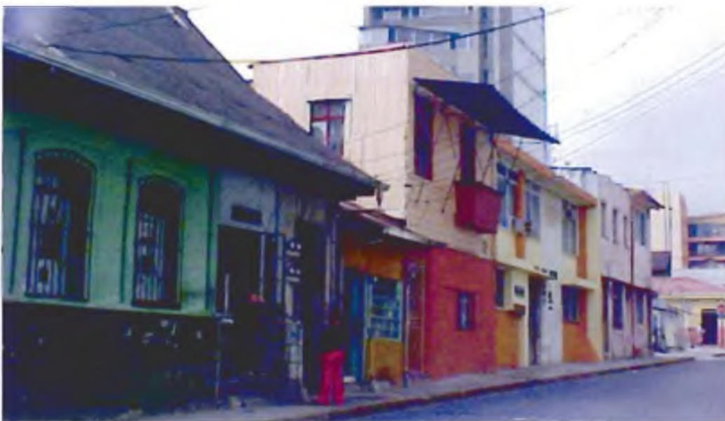
Calle tercera

donde existía un ambiente saludable y seguro para vivir, trabajar y estudiar, con toda clase de servicios y comercio, como librerías, bazares, tiendas, pulpería, panadería, sodas, ópticas, farmacias y toda clase de suministros para el estudio, la vivienda y la recreación. En síntesis, era un sector lleno de vitalidad porque existía una mezcla de usos variados que generaban esa rica diversidad que plantea Jane Jacobs, pero poco a poco se fue rompiendo ese equilibrio al permitirse los usos indeseables que fueron ahuyentando a los residentes, trabajadores y usuarios originales de este sector.