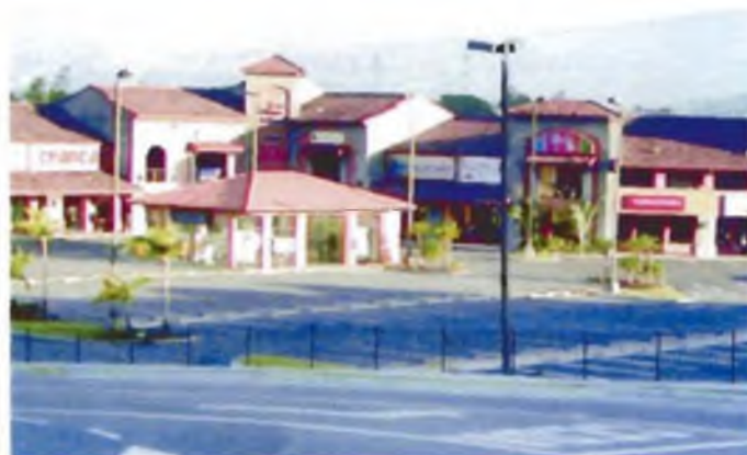
Plaza Itskatzú.