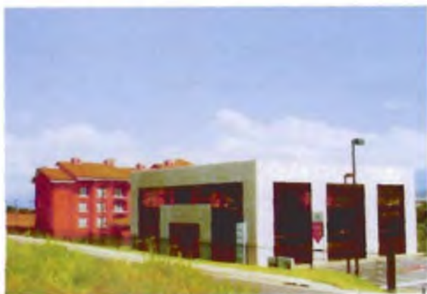
Trilogía ( Autopista a Santa Ana).

circule más valor tiene la localización. El valor económico del centro se basa principalmente, en el volumen de las actividades que se encuentran en él y en la extensión del área de mercado a que tiene acceso, por lo que entre más grande y más poblada sea la ciudad más valor tendrá el centro. Sin embargo los centros en muchas ciudades están en peligro, según Mario Polèse, debido a varios factores, políticos, económicos y sociales entre otros 16 .