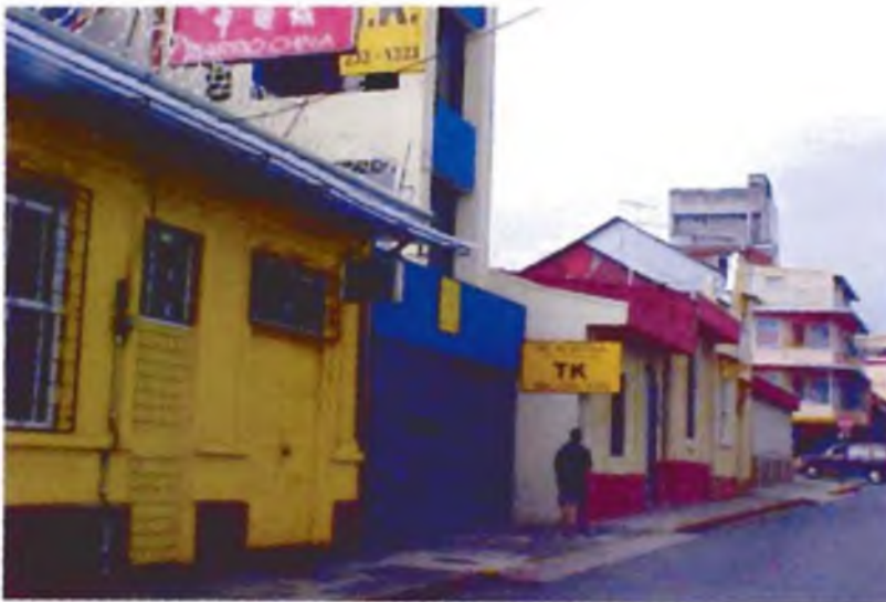
Calle tercera

proceso ha perjudicado la vitalidad de este espacio urbano pues como ya hemos visto, al no existir el uso residencial, en las noches el entorno cambia completamente y se vuelve despoblado de segmentos de población tales como niños, jóvenes, personas de tercera edad y familias completas, por lo cual se ha vuelto inseguro.