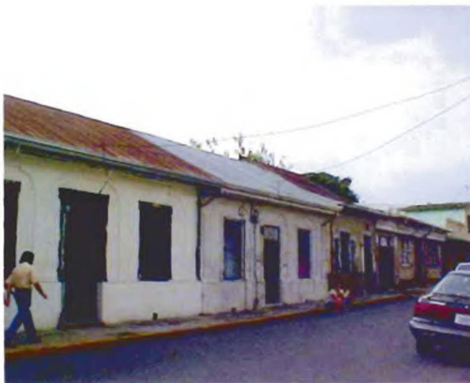
Calle primera

muchas ciudades y en particular el centro de la ciudad de San José, la situación socioeconómica de la población de esta área es muy baja. Muchos inmigrantes y población de escasos recursos se ubican en el centro de la capital para estar cerca de sus fuentes de ingreso o de sobrevivencia, como el comercio informal y también cerca de servicios públicos como hospitales, clínicas, escuelas, ayudas sociales y viviendas compartidas por varias familias, entre otras opciones.