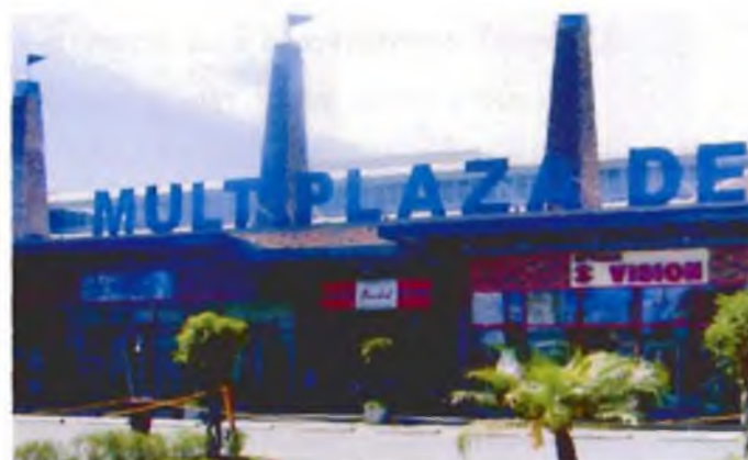
Multip plaza del Este.