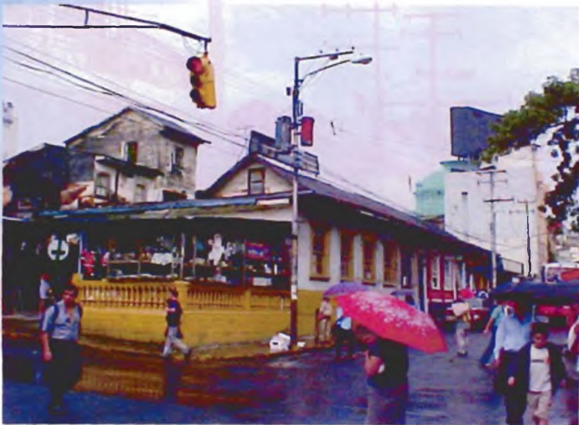
Calle quinta.

En síntesis si una ciudad es improductiva porque no genera rentas urbanas suficientes para financiar la construcción de la infraestructura pública necesaria, a causa de su mala planificación, la criminalidad, violencia, inseguridad y otros factores negativos, será poco atractiva para las empresas y los inversionistas. Por lo tanto, es necesario implementar estrategias efectivas de desarrollo urbano para convertir a las ciudades en motores de crecimiento económico y de generación de empleos.