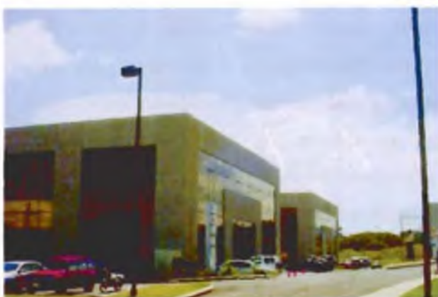
Trilogía ( Autopista a Santa Ana).