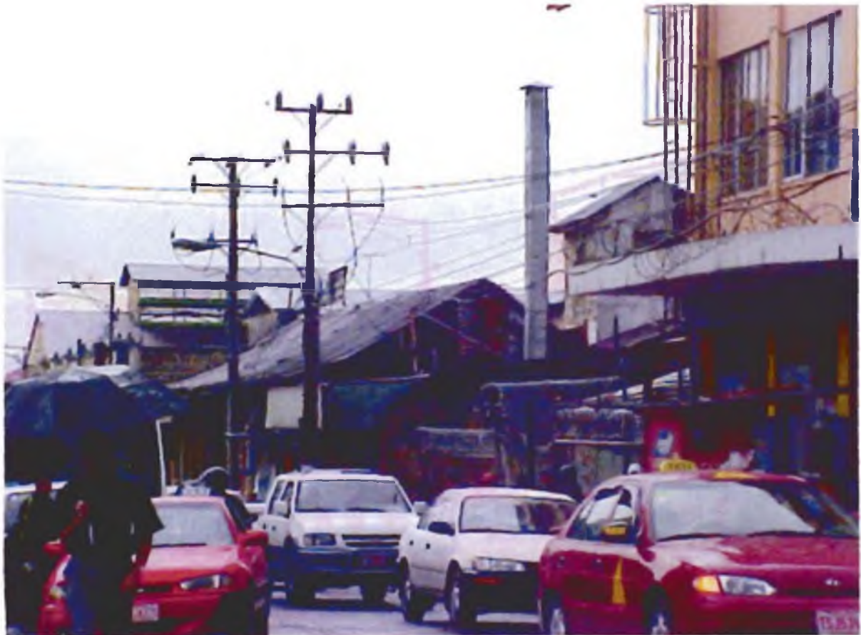
Calle quinta. Fuente: Arq. Hannia Marín

estén integrados. Esto no puede realizarse sin ciudades. Por lo tanto, las empresas productoras de bienes y servicios sensibles a las economías de escala buscarán ubicaciones “centrales” allí donde éstas existen”.