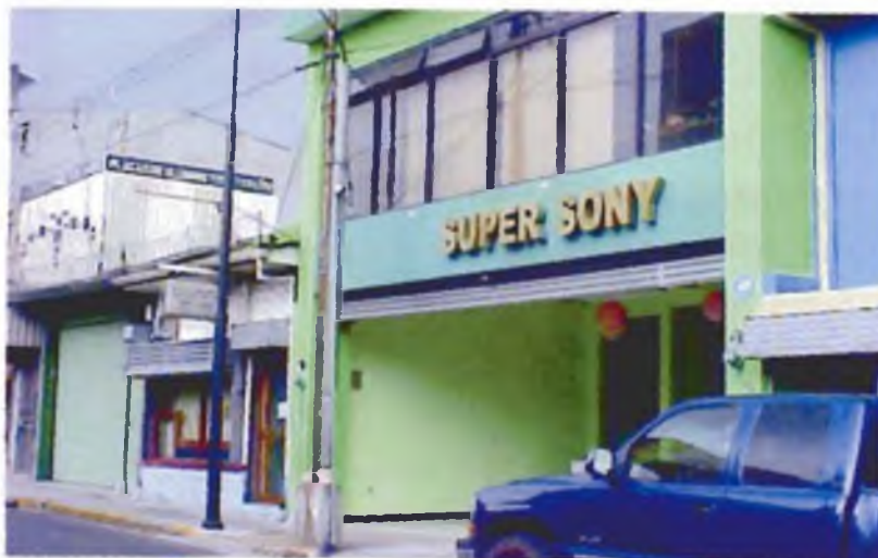
Calle tercera