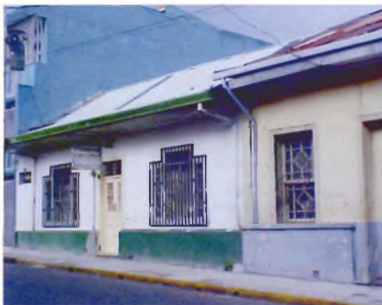
Calle tercera

de hombres que se han dedicado a esta actividad 19 . Aquí se representa también, la teoría de la renta de localización ya que, para los residentes, este sitio ya no ofrecía ninguna ventaja para quedarse allí. Sin embargo, los otros usuarios han repetido este uso hasta convertirlo en un lugar monótono, inseguro y marginado.