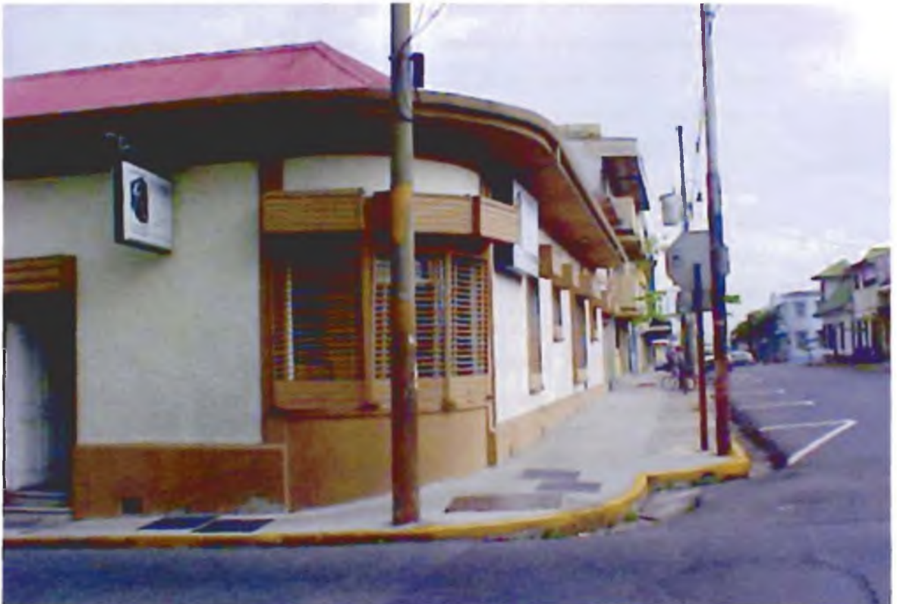
Calle tercera

pueda estar situada. La combinación de estas cuatro condiciones son necesarias para generar diversidad en la ciudad y la ausencia de alguna de ellas frustra su potencial 25 .