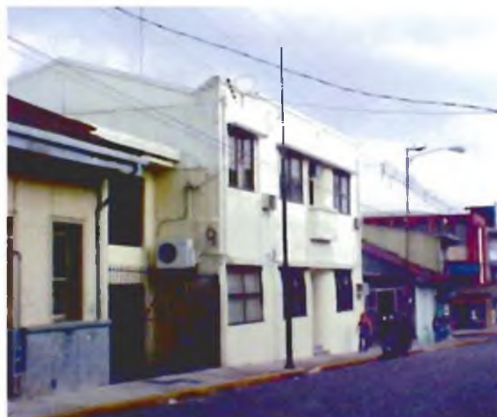
Calle tercera